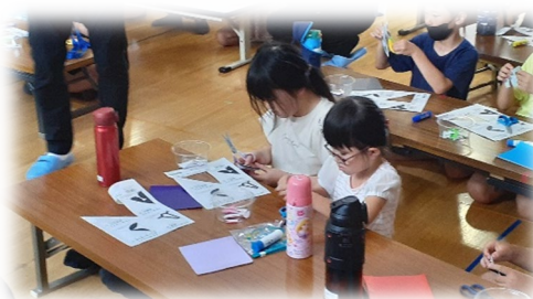
8/7(月) 仙台市博物館の方に来ていただいて紋切講座を行いました