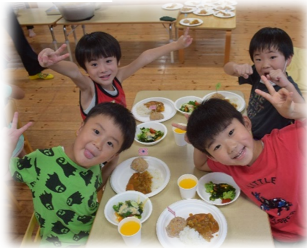
《カッパから手紙がきた!》